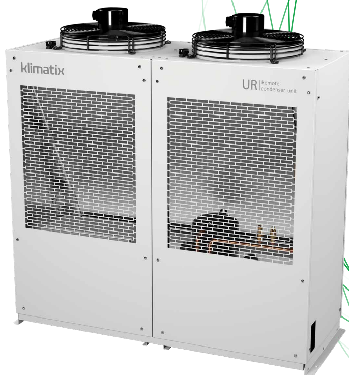
MODELO UR 17